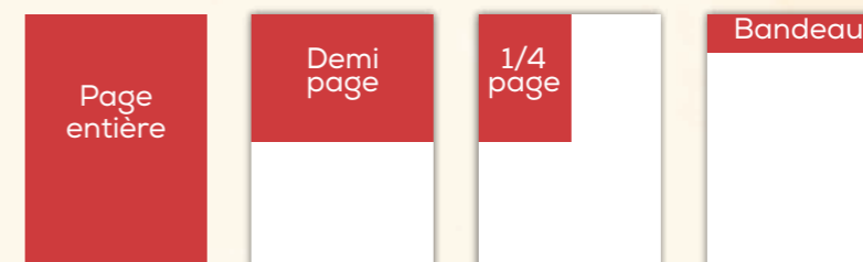
ILLUSTRATION DES ESPACES