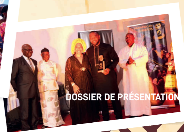
DOSSIER DE PRÉSENTATION