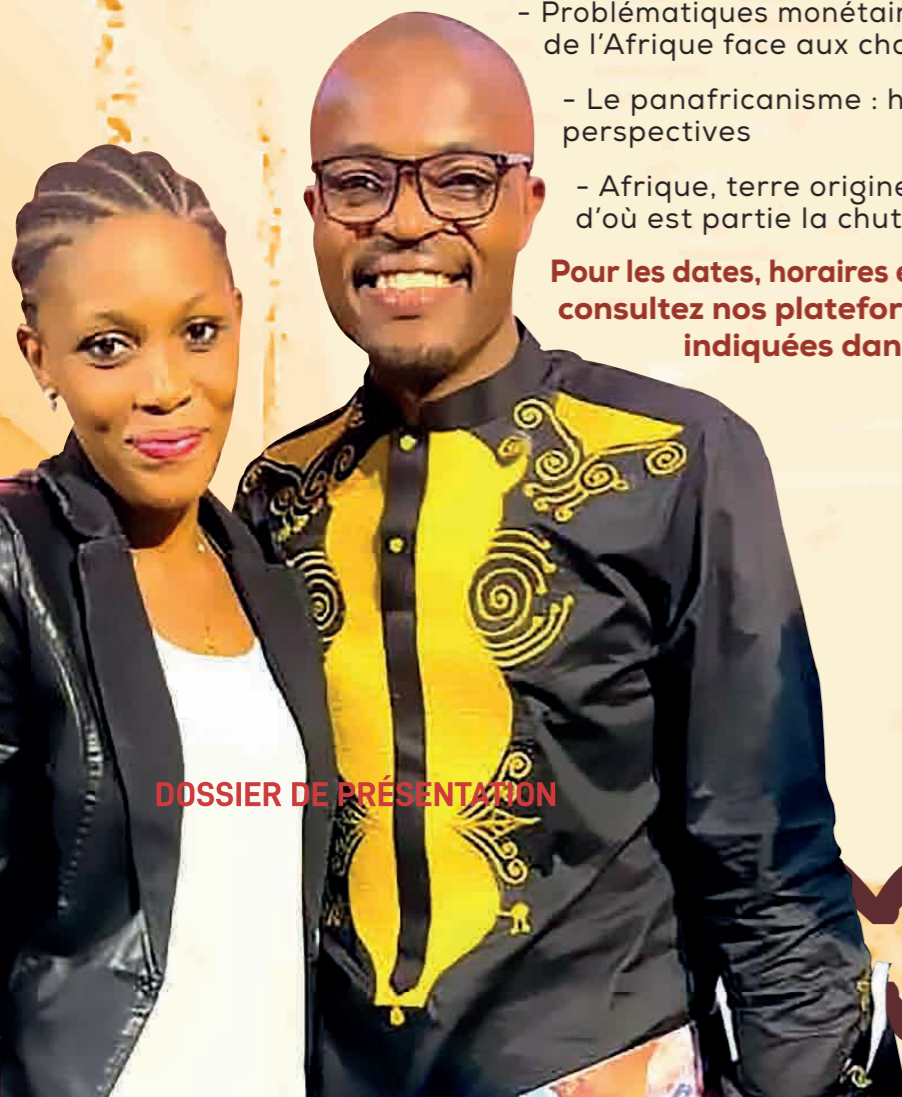
DOSSIER DE PRÉSENTATION

Pour les dates, horaires et intervenants, contactez-nous ou consultez nos plateformes internet aux adresses indiquées dans le présent document.